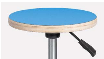
Istuinkorkeus säätyy portaattomasti istuimen alla olevasta kahvasta