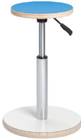
O500 Onni-aktiivituoli, laminaatti-istuin

Kuperan pohjalevyn ansiosta Onni-aktiivituoli aktivoi istujaa pysymällä liikkeessä, mikä edistää tasapainon kehittymistä ja lihasten aktivoitua. Aktiivituoli tehostaa myös aineenvaihduntaa ja verenkiertoa.