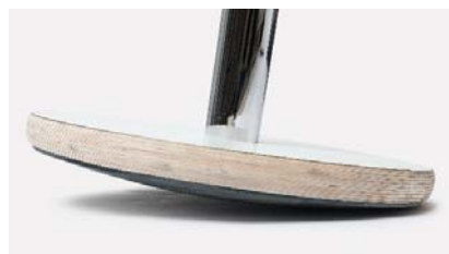
Kupera pohjalevy, jonka ansiosta istuin keinuu