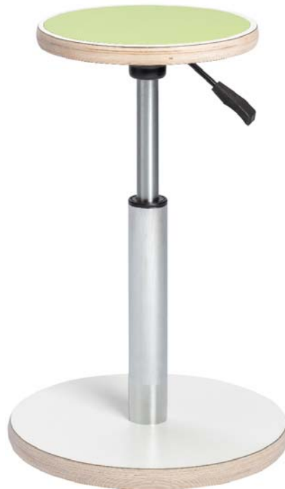
O500A Onni-aktiivituoli, Acoustic-istuin

Kuperan pohjalevyn ansiosta Onni-aktiivituoli aktivoi istujaa pysymällä liikkeessä, mikä edistää tasapainon kehittymistä ja lihasten aktivoitua. Aktiivituoli tehostaa myös aineenvaihduntaa ja verenkiertoa.