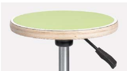
Istuinkorkeus säätyy portaattomasti istuimen alla olevasta kahvasta