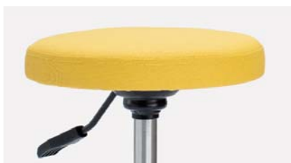
Istuin korkeus säätty portaattomasti istuimen alla olevasta kahvasta